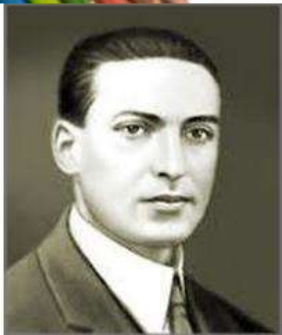
Л. С. Выготский