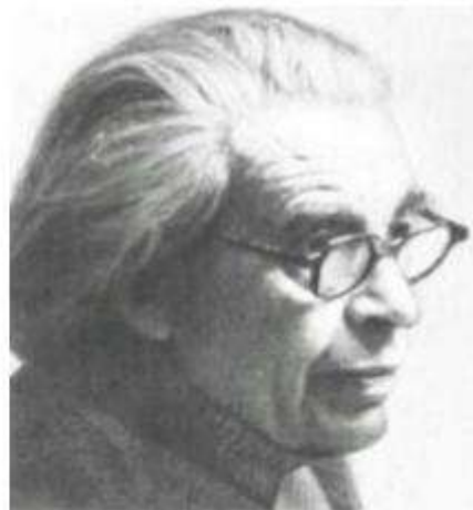
Д. Б. Эльконин